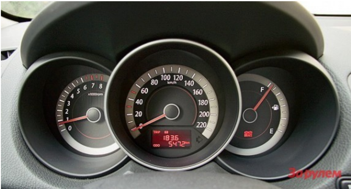
Приборы крупные и информативные