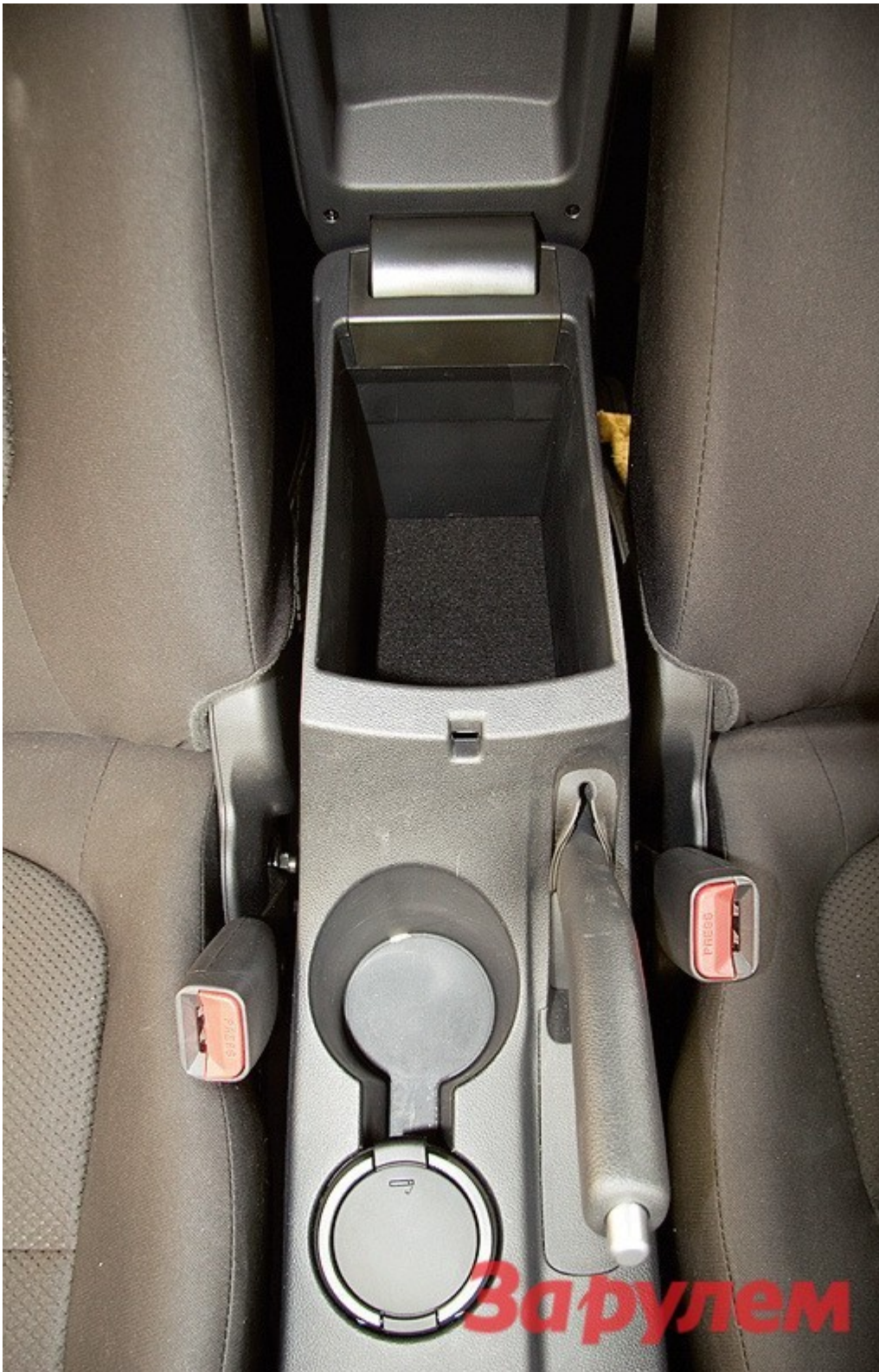
Между креслами два подстаканника и вместительный бокс

Посадка за рулем ничуть не менее удобная, чем в KIA, однако наклоненные вперед по французской традиции приборы понравятся не всем, а обзорность назад из-за покатога, как у купе, стекла оставляет желать лучшего. Зато качество отделочных материалов едва ли не высочайшее в классе – внутри Fluence не покидает ощущение, что его убранство сохранит товарный вид даже после нескольких лет эксплуатации.