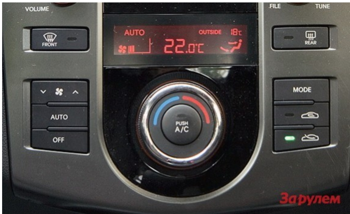
Управлять климат-контролем можно на ощупь

Климат-контроль хоть и не отдельный, но добросовестно справляется со своими обязанностями в лютую июльскую жару, а управление им интуитивно понятно. Звучание штатной аудиосистемы по меркам своего класса на твердую четверку и позволяет прослушивать любимые музыкальные композиции на приличном уровне громкости без сильных частотных искажений. Аудиосистема Renault хороша лишь в фоновом режиме, но если прибавить громкость, становится очевидна слабость усилителя. Двухзонный климат-контроль порадовал наличием «мягкого» и «быстрого» режимов работы, но управлять качающимися вверх-вниз клавишами на ощупь невозможно – приходится отрывать взгляд от дороги.